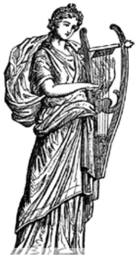
MÚZA ERATÓ SE TAKÉ STANE VAŠÍ PRŮVODKYNÍ

Zahrada Centra 83 je jako stvořená pro literární rozjímání a nic tedy nebrání tomu, abyste se společně s naším souborem vydali do říše múz. Průvodkyněmi vám budou, alespoň pomyslně - Erató (múza milostného básnictví a milostných písní), Euterpé (múza lyrického básnictví), Kalliope (múza epického básnictví) a Thaleia (múza veselého básnictví, komedie a pastýřských zpěvů). Šťastnou cestu.