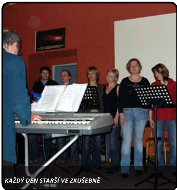
KAŽDÝ DEN STARŠÍ VE ZKUŠEBNĚ

Sekce sboru PAPERSEK - dnes již s názvem "Každý Den Starší" (dříve nazývaná XXL, ale některé dámy protestovaly) se zformovala v roce 2004 v Peci pod Sněžkou na chatě Svornost. Během původně nenápadného setkání všech, kdo Paprskem prošli, se zrodila myšlenka: JEDEME DÁL! Repertoár "K.D.S." sahá od gospelů přes písně z muzikálů až po jazz. Cílem jsou vokální aranžmá stylu Singers Unlimited. Jak šel čas, počet nadšenců ubýval, až se ustálil na kolísavém čísle 15. Dnes už dosáhnou na leckterou jazzůvku, ale v podstatě se nevyhýbají téměř čemukoliv, proto také většinou vyčuhují z řady.