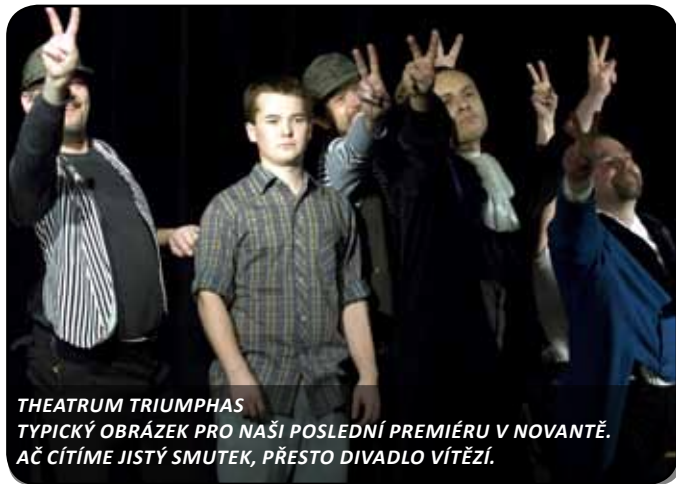
THEATRUM TRIUMPHAS TYPICKÝ OBRÁZEK PRO NAŠI POSLEDNÍ PREMIÉRU V NOVATĚ. AČ CÍTI ME JISTÝ SMUTEK, PŘESTO DIVADLO VÍTĚZÍ.

V sezoně 2008 - 9 počaly sílit tlaky ze strany majitele objektu. Postupně jsme byli jako divadlo vymezováni z doposud užívaných prostor.