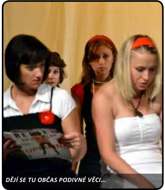
DĚJÍ SE TU OBČAS PODIVNÉ VĚCI...