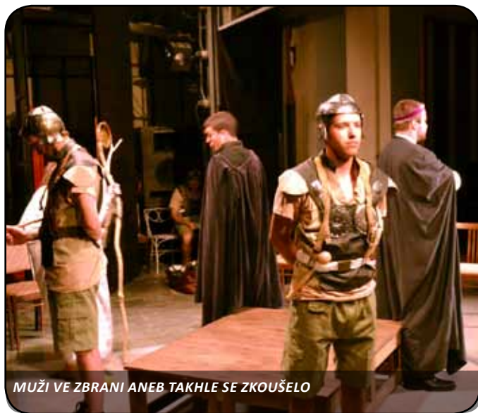
MUŽI VE ZBRANI ANEB TAKHLE SE ZKOUŠELO

Poslední třetina divadelního matche bude poněkud odlišná, jednak bude trvat skoro celý den - začínáme ráno v 10:00 pohádkou a za druhé se pomalu přesuneme do jiného místa ve vesmíru. Ano, ocitneme se na Zeměploše Terryho Pratchetta.