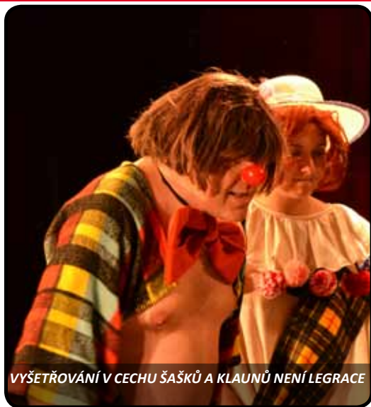
VYŠETŘOVÁNÍ V CECHU ŠAŠKŮ A KLAUNŮ NENÍ LEGRACE