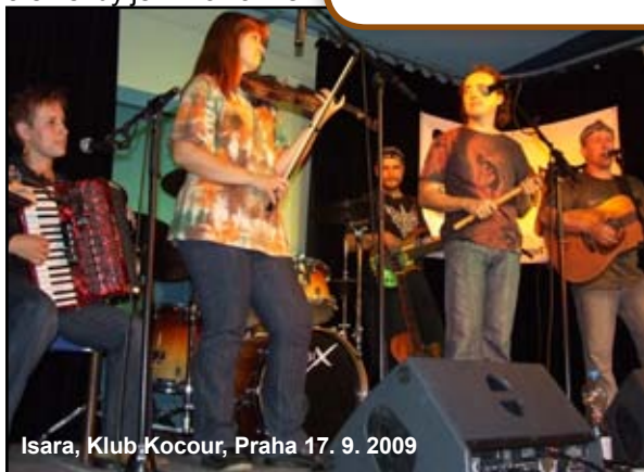
Isara, Klub Kocour, Praha 17. 9. 2009